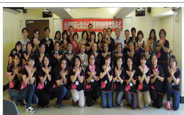
當日參與捐贈儀式的扶輪社社員與勵馨同仁