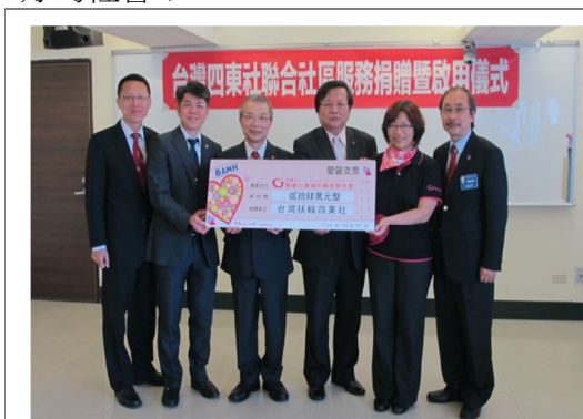
感謝台灣扶輪四東社捐贈 24 萬元整

以上種種的服務效益，若不是因著台中東南扶輪社重視專業工作的軟硬體配備的提升，我們是沒辦法做到這個服務成果的。再次感謝東南扶輪社的社友們，您的支持讓勵馨知道，在這條助人的專業上，我們並不孤單，並且我們正一起創造一個更美好的社會！