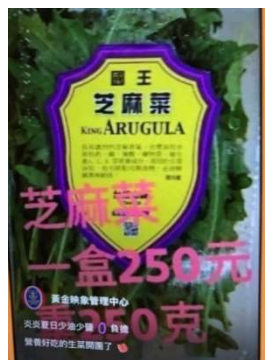
▲台灣販賣的芝麻葉