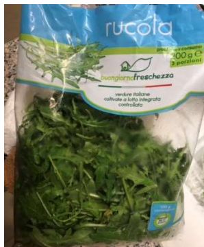
▲義大利旅遊中購買的芝麻葉

99 健康網 https://zyk.99.com.cn/zyfj/zysy/2017/0929/710568.html