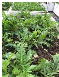
◀陽台菜園收成的芝麻葉