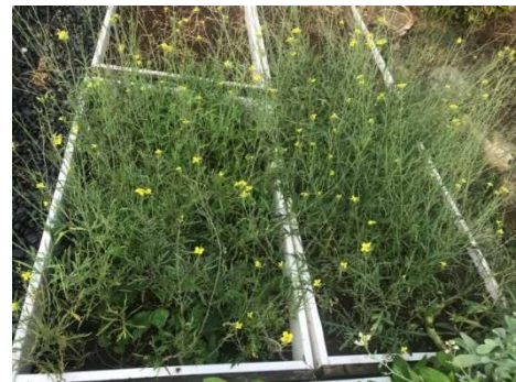
▲開花結籽的芝麻葉