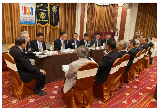
▲7 月理事會暨助理總監行政會議