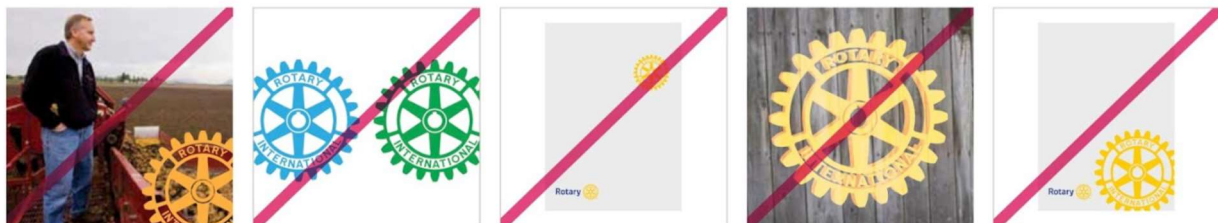
Mark of excellence

Keep the mark of excellence whole — never cropped.