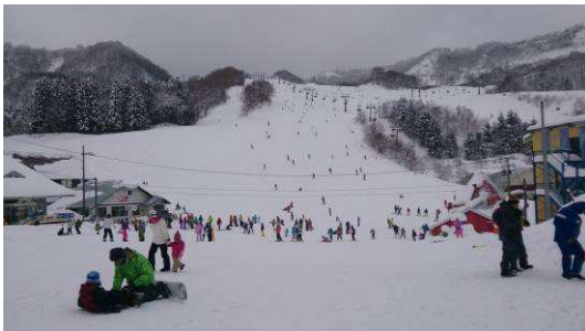
【兵庫縣 八千北高原】

在氣候溫暖的台灣幾乎不太可能看得到雪，所以得知有這項活動後就一直很期待！這個活動不只是可以看得到雪啊！而是可以體驗在台灣比較難體驗到的滑雪活動！所以當我們到了滑雪場後就像小孩子一樣非常興奮，帶我們去滑雪場的竹山夫妻看到我們這麼開心也十分熱心的教我們這些滑雪初學者滑雪應該要抓住哪些重點比較容易保持自己的平衡。但其實對我來說，一開始最難的地方竟然是看似簡單的「跌倒了要自己學會爬起來」。