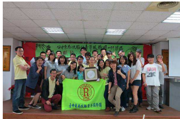
職業參訪-《正五傑機械股份有限公司》