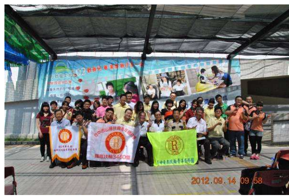
社區活動 - 《享中秋做月餅》