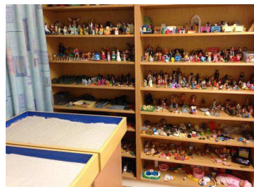
台中蒲公英諮商輔導中心 空間目前現況 7-沙遊室