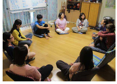
婚暴女性自我照顧團體