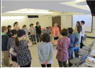
邀請國際講師為助人工作者進行專業訓練