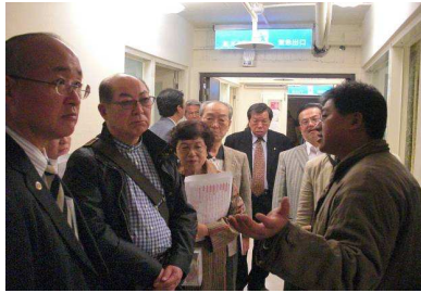
日本扶輪社參訪台中蒲公英諮商輔導中心