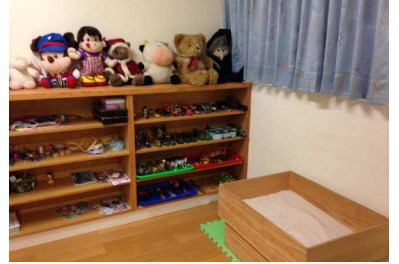
台中蒲公英諮商輔導中心 空間目前現況 8-遊戲室