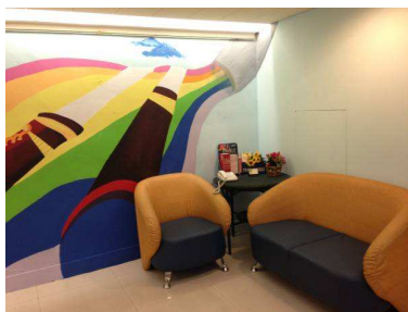
台中蒲公英諮商輔導中心空間 目前現況 3-展示接待區