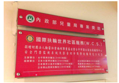
台中蒲公英諮商輔導中心空間 目前現況 2-入口處徵信