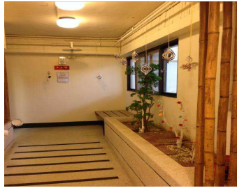
台中蒲公英諮商輔導中心空間 目前現況 1-電梯出口區