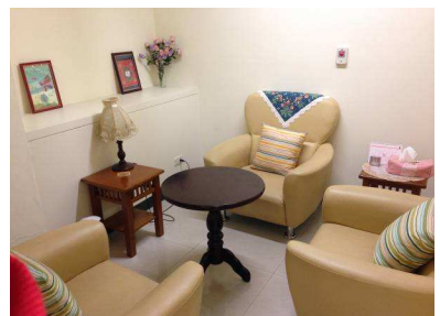
台中蒲公英諮商輔導中心 空間目前現況 5-會談室