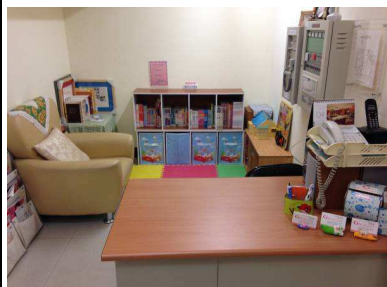
台中蒲公英諮商輔導中心空間 目前現況 4-接待托育區