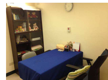
台中蒲公英諮商輔導中心 空間目前現況 6-心測室(此 計畫擬建置處；目前同為 個別諮商/會談、藝術治療 之多元運用空間)