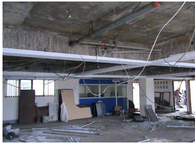
台中蒲公英諮商輔導中心 籌設前的樣貌