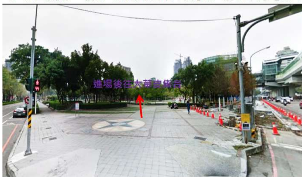
B、D 區及扶少、扶青、RYE 遊行隊伍：文心路一段 VS 大墩七街口